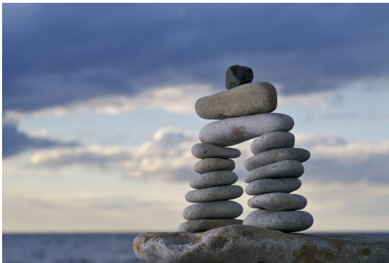
koordinere = å virke sammen

Dersom du synes det er vanskelig å møte tjenesteapparatet alene, har du rett til å ha med en person som du har tillit til i arbeidet med den individuelle planen.