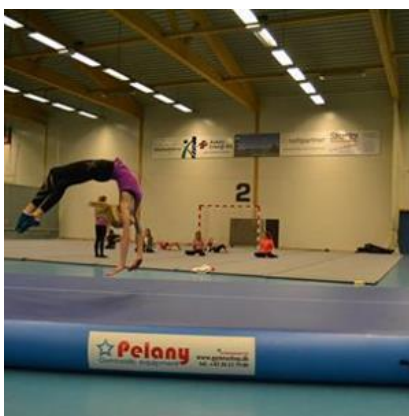
Askøy Turn og Sportsdrill er en av de mest aktive klubbene i våre haller.