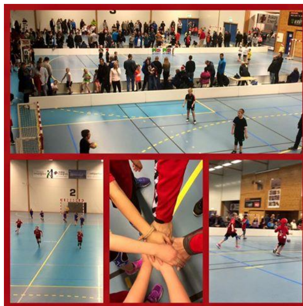
Askøy Håndballklubb leier baner tilsvarende 2,5 håndballhall i løpet av sesongen og arrangerer flere titalls stevner og arrangementer, spesielt i Askøy Forum