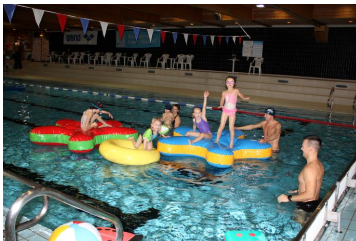
Tross sine 45 år er Askøyhallen fremdeles stedet der alle små Askøybarn lærer å svømme, enten i regi av skolen, av øyens svømmeklubber eller gjennom lek og moro i den offentlige åpningstiden.