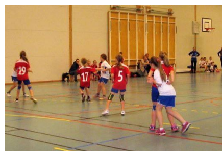
Askøy Håndballklubb har over 600 medlemmer som alle har Askøy Forum som hjemmebane.