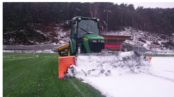
Askøyhallene KF er en allsidig arbeidsplass.