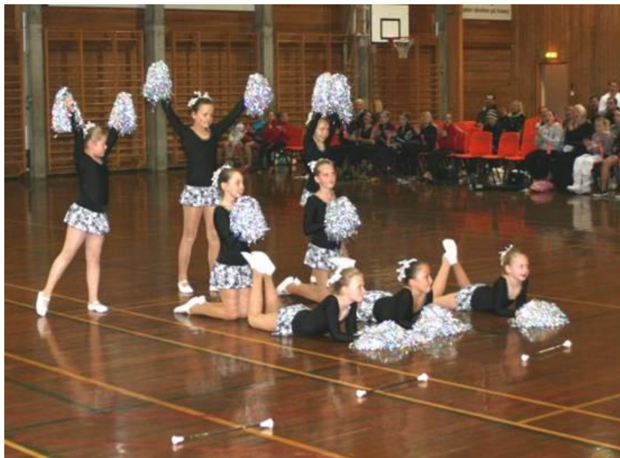
Korpsdrillaspiranter fra Hetlevik