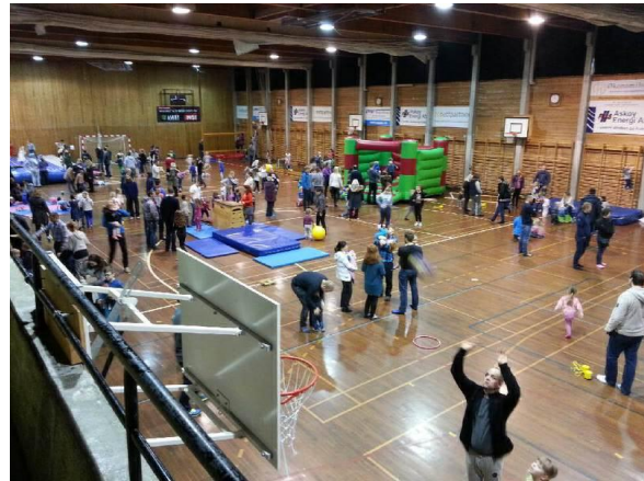
Åpen Hall i Askøyhallen er blitt fast og etterspurt samlingsted for barn og foreldre søndagen høst og vinter.