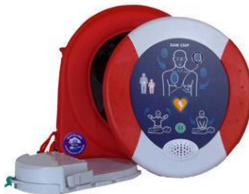
Det er installert hjertestartere i alle bygg.

Askøyhallen og Askøy Forum er registrert som særskilte brannobjekter, og spesielt i Askøyhallen er det mange anmerkninger i forhold til brannsikkerhet knyttet til bygget. Dette er forhold som må håndteres gjennom Askøy kommune som eier. Foretaket får gode tilbakemeldinger fra tilsynsmyndighetene på de organisatoriske siden av brannvernberedskapen.