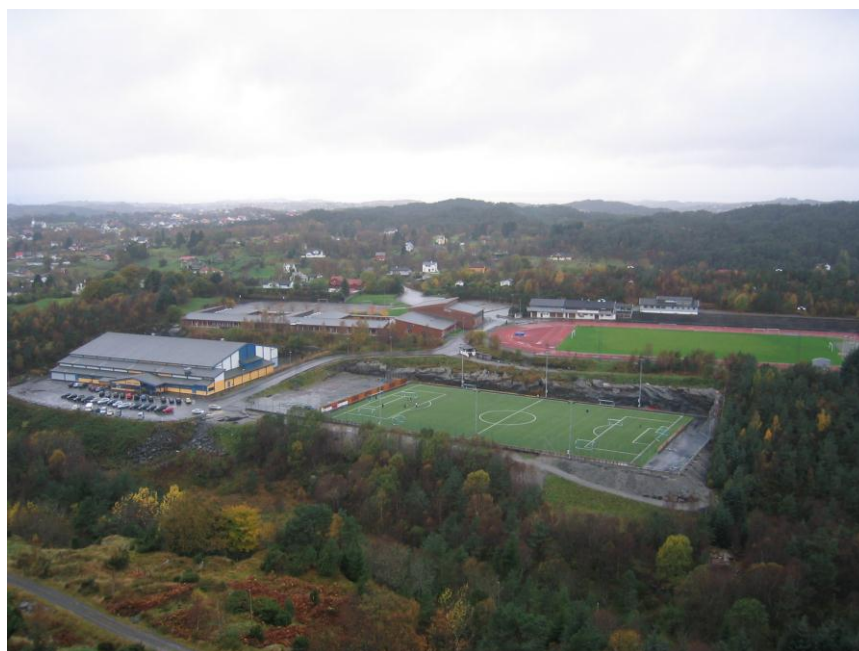
Askøy Forum og Ravnanger Idrettspark

Askøy Forum ble ferdigstilt april 2004. Hallen er en av de største i sitt slag i Norge, og inneholder en idrettshall på 75*45 meter, 75 meter piggskodekke med 3 oppmerkede 60 meterbaner, 6 garderober, kiosk, styrkerom og møterom/kafeteria. Hallen er godkjent for 2000 samtidige brukere, og er en del av et praktfullt idrettsanlegg på Ravnanger med friidrettstadion, gressbane og flere grusbaner. Området er omringet av et flott friluftsområde med stor muligheter for orientering og løping i skog og mark. Hallen kostet ferdig oppført 35 millioner og ble delvis finansiert vha. tippemidler.