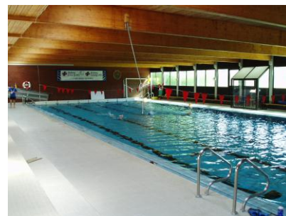
Askøyhallen (øverst) og Askøy Terapibad (under)

Askøyhallen er en kombinert idrettshall og svømmehall. Hallen ble bygget i 1971 og har dermed i i snart 45 år gjort tjeneste som Askøys eneste svømmehall, og i 30 år som eneste idrettshall. På dagen er den gymsal for Kleppestø Ungdomskole og Askøy Videregående skole, og på ettermiddag/kveld er den arena for Askøys mange idrettslag. Askøyhallen har parkettgulv, er merket for håndball, basketball, volleyball og badminton, og har tribuner til 300 mennesker. Salen kan deles i 4 like store gymsaler.