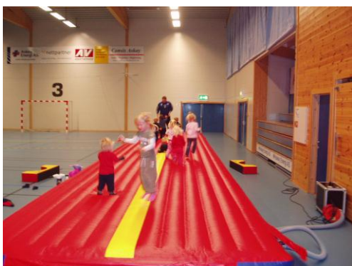
Forum Barnehage har store arealer innendørs å boltre seg på

Videre fakturer vi forskjellige avdelinger i kommunen slik;