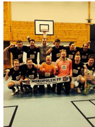
De regionale 1.divisjonseriene har sluttspill i Askøy Forum for å avgjøre hvem som skal spille i nasjonal eliteserie. Nordpolen FF fra Ofoten (th) ble en av vinnerne.

Som et eksempel på aktivitetsnivået ble det i Askøy Forum fra første helgen i januar til siste helgen i desember gjennomført 71 forskjellige små og store arrangementer. Disse varierte i størrelse fra en enkel volleyballkamp i damenes 2 divisjon til AFKs Nobi Julecup som strekker seg over 10 hele dager. Askøy Håndballklubb hadde alene 25 heldagsarrangementer, ikke iberegnet hverdagskamper, og gjennomførte nærmere 500 kamper i løpet av året.