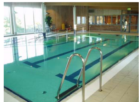
Askøyhallen (øverst) og Askøy Terapibad (under)

Siden 1/1 2007 har foretaket også hatt ansvaret for drift av Ravnanger Idrettspark med friidrettsanlegg, gressbane og kunstgressbane, samt gressbanene på Bergheim og Follese og kunstgressbanene i Myrane, på Erdal og Davanger. Høsten 2007 overtok Askøyhallene KF også driften av den nye kunstgressbanene på Finamyrane, Ask. Etter hvert har også Follese FKs nye anlegg på Skogen kommet med i avtalen, og høsten 2011 åpnet også Norsiden ny flott kunstgressbane på Træet. Alle disse anleggene inngår i Askøyhallene KFs driftsavtale med Askøy Kommune. I 2010 ble det inngått avtale om drift av Ravnanger Grendahus. Denne sikrer at brukerne av Grendahuset inkl. skolen får satt opp Grendahuset slik de ønsker det til sine arrangement, og enkle driftsoppgaver som er knyttet til arrangementene blir utført.