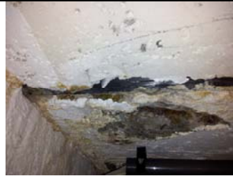
Nok å ta tak i i Askøyhallen. Bildet viser lekkasje fra bassenget og ned i teknisk rom.

Utfordringene de kommende årene vil først og fremst knytte seg til å bruke nok nødvendige midler på å holde Askøyhallen i drift, og samtidig ikke bruke mer enn nødvendig på dette anlegget. Samtidig vil både Askøy Forum og Askøy Terapibad etter hvert kreve mer og mer vedlikeholdsinnsats.