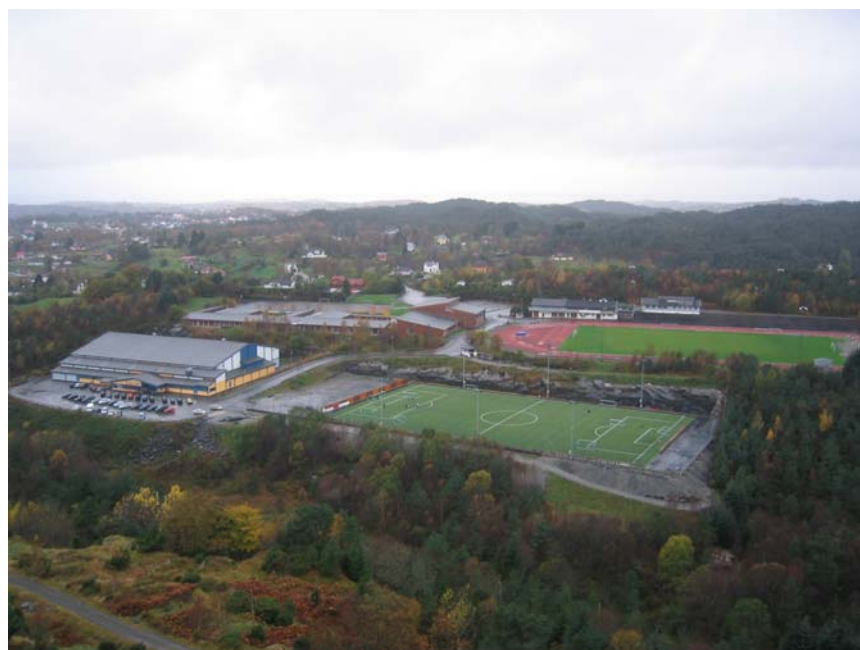
Askøy Forum og Ravnanger Idrettspark

Askøy Forum ble ferdigstilt april 2004. Hallen er en av de største i sitt slag i Norge, og inneholder en idrettshall på 75*45 meter, 75 meter piggscodekke med 3 oppmerkede 60 meterbaner, 6 garderober, kiosk, styrkerom og møterom/kafeteria. Hallen er godkjent for 2000 samtidige brukere, og er en del av et praktfullt idrettsanlegg på Ravnanger med friidrettstadion, gressbane og flere grusbaner. Området er omringet av et flott friluftsområde med stor muligheter for orientering og løping i skog og mark. Hallen kostet ferdig oppført 35 millioner og ble delvis finansiert vha. tippemidler.