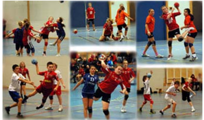
En vanlig helg i Askøy Forum