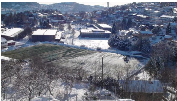
Liten traktor driver snørydding på stor bane

Selv om det i kontrakten heter at vi ikke driver brøyting av baner, så hjelper vi når vi kan og det er forsvarlig. Da er det stort sett snøens beskaffenhet, om det er glatt på veiene, og tiden som setter grensene.