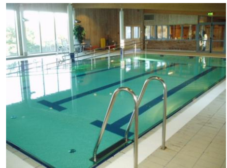
Askøyhallen (øverst) og Askøy Terapibad (under)