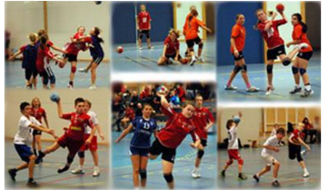
En vanlig helg i Askøy Forum