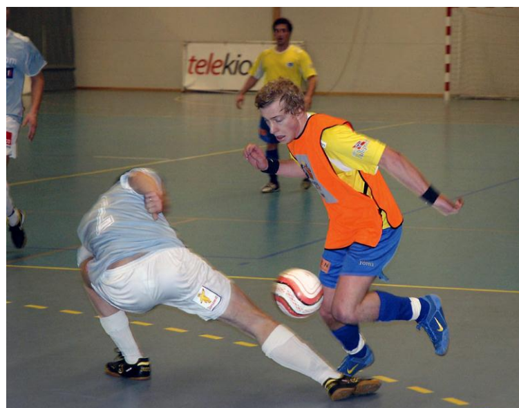
Bilde: I vår ble avslutningsspillet i historiens første Eliteserie i Futsal lagt til Askøy. Fyllingen (i gult) klarte å unngå nedrykk med et nødsskrik.

-Samarbeidet med NFF og Askøy Fotballklubb. Flere kvalifiseringsrunder til Eliteserien i Futsal ble gjennomført i Askøy Forum med deltakere fra hele landet, og selv om de var få lokale helter å se på banene er det inspirerende å få være med å dra i gang det som i norsk sammenheng er en ny idrett, men som har røtter i de mer eller mindre organiserte innendørscuper som vi også på Askøy har mange av. NFF har signalisert at Askøy Forum er en av de hallene de ønsker å bruke til dette formål framover.