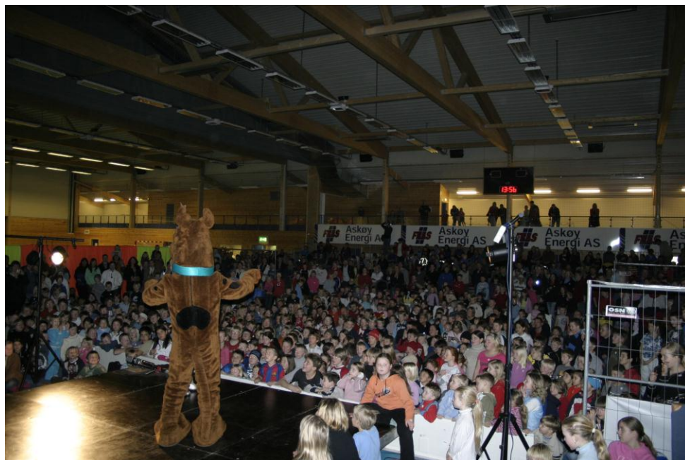
Familedag i Forum.

** bl.a. reklame, automatinntekter, driftsoppdrag, finans og ekstraordinære tilbakeføringer