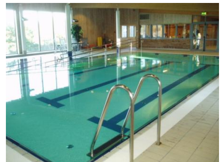
Askøyhallen (øverst) og Askøy Terapibad (under)

Siden 1/1 2007 har foretaket også hatt ansvaret for drift av Ravnanger Idrettspark med friidrettsanlegg, gressbane og kunstgressbane, samt gressbanene på Bergheim og Follese og kunstgressbanene i Myrane, på Erdal og Davanger. Det er naturlig at en kommende bane på Finamyren, Ask, også vil bli driftet av Askøyhallene KF.