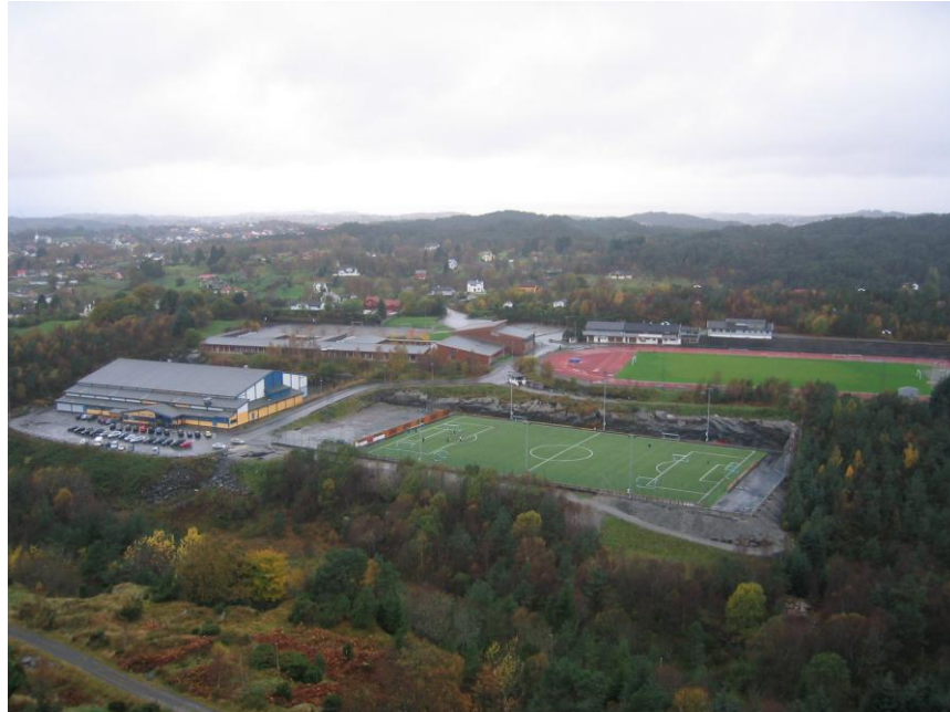
Askøy Forum og Ravnanger Idrettspark

Askøy Forum ble ferdigstilt april 2004. Hallen er en av de største i sitt slag i Norge, og inneholder en idrettshall på 75*45 meter, 75 meter piggscodekke med 3 oppmerkede 60 meterbaner, 6 garderober, kiosk, styrkerom og møterom/kafeteria. Hallen er godkjent for 2000 samtidige brukere, og er en del av et praktfullt idrettsanlegg på Ravnanger med friidrettstadion, gressbane og flere grusbaner. Området er omringet av et flott friluftsområde med stor muligheter for orientering og løping i skog og mark. Hallen kostet ferdig oppført 35 millioner og ble delvis finansiert vha. tippemidler.