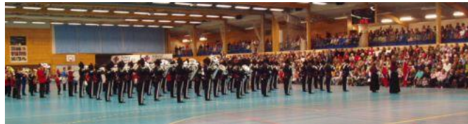
HMK Gardens musikkorps

-I 2007 merket vi for første gang pågang fra Norges Fotballforbund som nå skal starte opp med offisielle Futsal-turneringer. Dette vil bare øke på, og vi har fått tilbakemelding på at NFF vil bruke Askøy Forum mer til slike arrangementer framover. Det kan bli en utfordring å få dette til å passe sammen med eksisterende aktivitet.