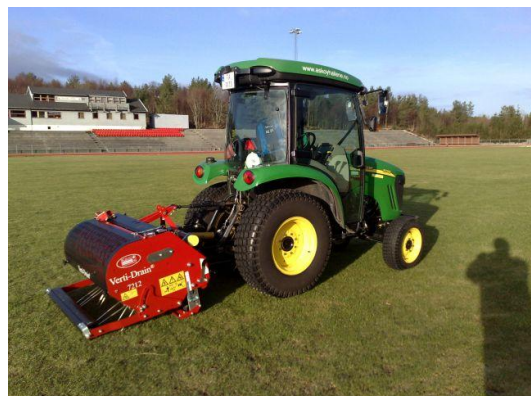
Traktor med Vertidrain.

I tillegg er det blitt investert i en såkalt vertidrain for lufting og hulling av gressbaner sammen med Kulturkontoret i Askøy Kommune. Dette utstyret har en innkjøpsverdi på kar 135 000,-