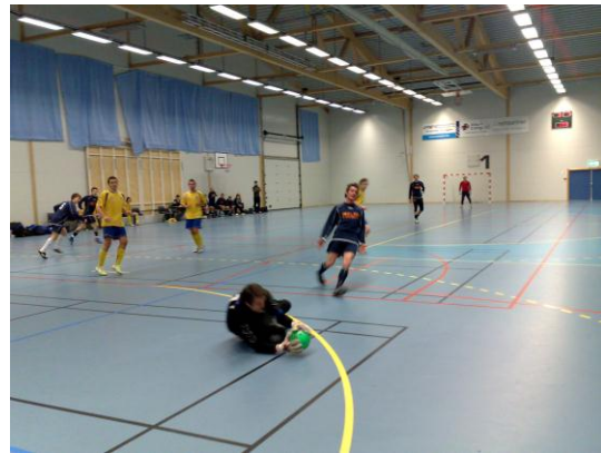
Fra innledende runder i kvalifiseringen til NFF Eliteserie i Futsal.

-I 2007 merket vi for første gang pågang fra Norges Fotballforbund som nå skal starte opp med offisielle Futsal-turneringer. Dette vil bare øke på, og vi har fått tilbakemelding på at NFF vil bruke Askøy Forum mer til slike arrangementer framover. Det kan bli en utfordring å få dette til å passe sammen med eksisterende aktivitet.