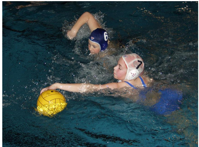
Fra Askøy Vannpoloklubbs årlige stevne

Meningen er å legge til rette for fri aktivitet, og det er kjøpt inn utstyr til formålet.