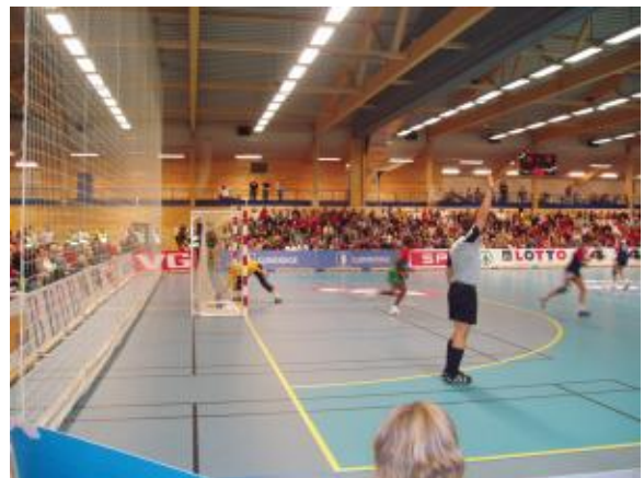
Fra første offisielle landskamp på Askøy.

De provisoriske tribunene kommer på plass. Tribunene kostet oss ca 50 000,-, tar opptil 500 personer og det tar 4 mann ca 4 timer å sette opp.