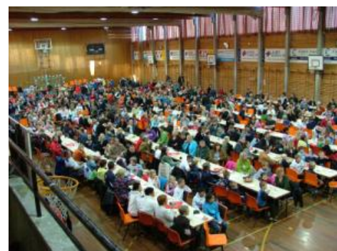
Fra AFK's årsavslutning for yngre avdelinger i Askøyhallen

Også vårens LanParty trekker mange ungdommer, og disse arrangementene ser ut til å ha kommet for å bli. Kommunens kulturavdeling har arrangert 10 Nattåpent gjennom året i Askøyhallen, de fleste til fullt hus.