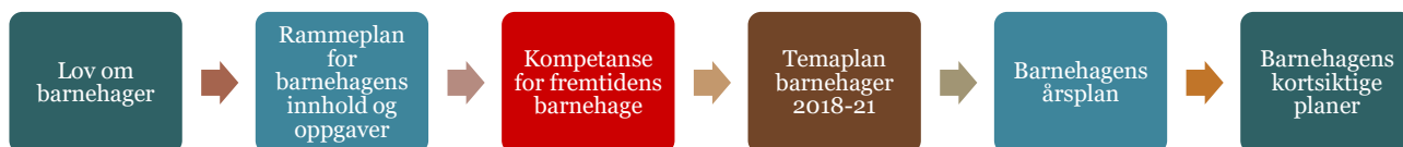
Figur 1: Planhierarki

Årsplanen er et arbeidsredskap for personalet og dokumenterer barnehagens valg og begrunnelser. Årsplanen kan også gi informasjon om barnehagens pedagogiske arbeid til myndighetsnivåene, barnehagens samarbeidspartnere og andre interesserte.